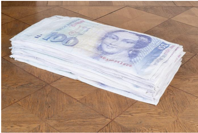
01 WARBURG Nicholas Warburg, Die Oberen 10.000, 2020, 130 x 70 x 50 cm, 100 bedruckte Handtücher, Foto: Anton Janizewski