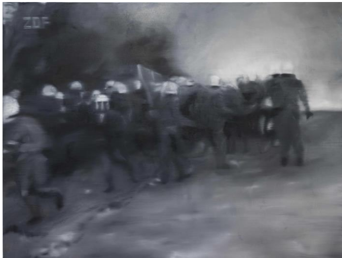
02 WARBURG Nicholas Warburg, Kampf der Welten, 2021, 150 x 200, Öl auf Leinwand