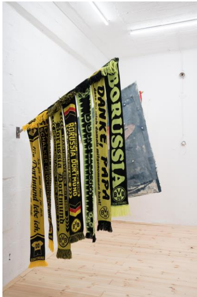
04 KORBACH Jody Korbach, Identitätspolitik, Strukturwandel und Danke für gar nichts (Papa), 2021, Fanschals, Foto: Jana Buch