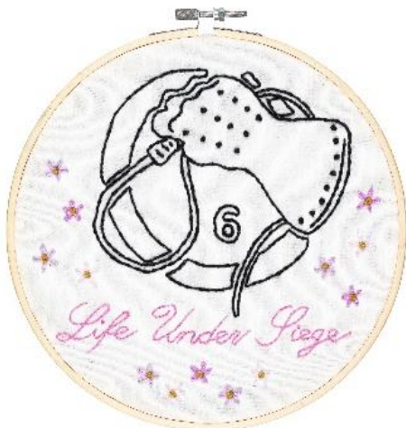
06 SAUR Nicolai Saur, Der Wind in den Weiden spielt in Hyperborea, 2022, Stoff und Garn, Foto: Marc Rodenberg