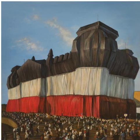
05 SAUR Nicolai Saur, Reichstag, 2022, Acryl auf Leinwand, Foto: Marc Rodenberg