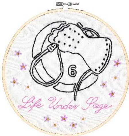
06 SAUR Nicolai Saur, Der Wind in den Weiden spielt in Hyperborea, 2022, Stoff und Garn